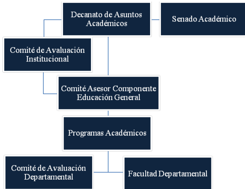
Gráfica 3: Organigrama del Componente de Educación General de la UPRH

En el proceso de implantación y en el funcionamiento del Componente de Educación General de la Universidad de Puerto Rico en Humacao se integrarán los esfuerzos y los recursos de distintas instancias de la Institución. La tarea de implantar los procesos y elementos del CEG en el currículo de la UPRH es una tarea formidable que requiere mucha energía y un trabajo en equipo. Requiere además, el compromiso de toda la comunidad universitaria de la UPRH. A continuación se muestra una gráfica que ilustra la organización administrativa del CEG.